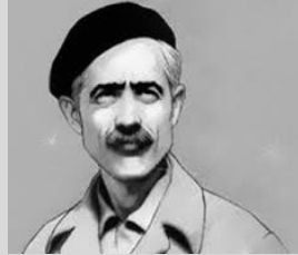
زنده یاد جلال آل احمد